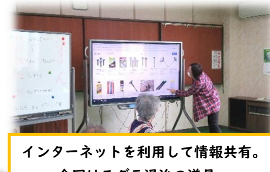
インターネットを利用して情報共有。 今回はモグラ退治の道具。