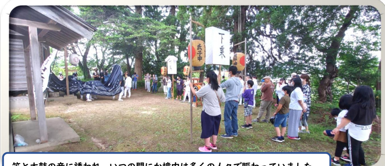
笛と太鼓の音に誘われ、いつの間にか境内は多くの人々で賑わっていました。