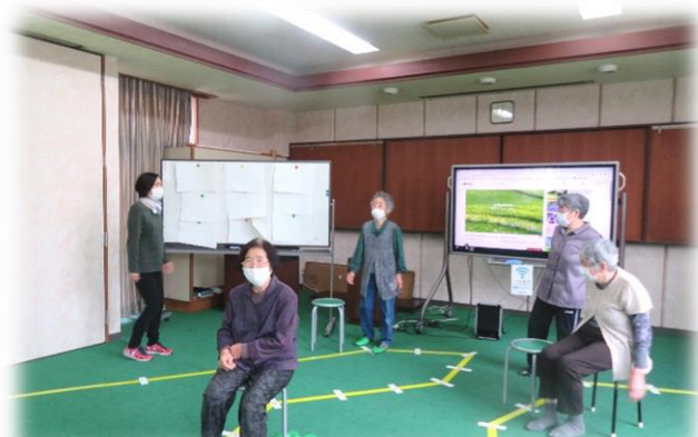
自分の誕生日を一の位になるまで足してください。その数進めます。