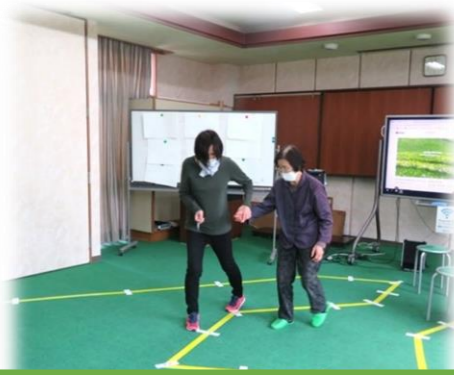
どれ、一緒にあいべ、いち・にー・さん・