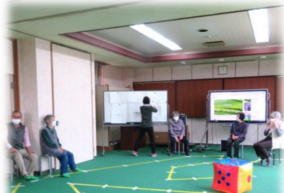
お題はこの中に。えー！ふりだしに戻る！？