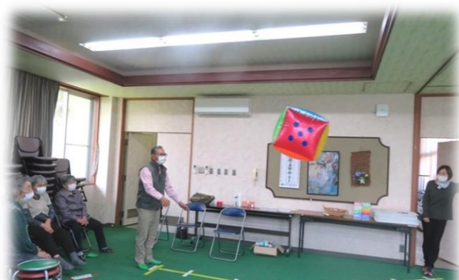
おっきいな出ろ！ねらった数は出せるか！！

6月1日(水)、いきいき教室の開級式と『人間すごろくゲーム』を行いました。 大きいサイコロをそれ〜！！出た数を自分が進みます。時々頭や体を使う指令があったり、進んだり戻ったり。さあ勝負のゆくえは??大爆笑の大盛り上がりでした。